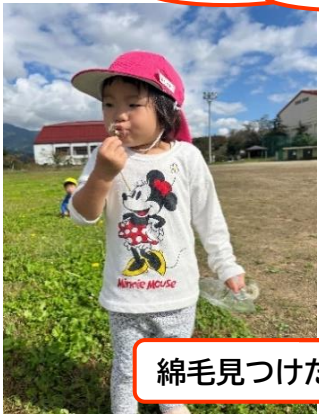
綿毛見つけた！ふうー！