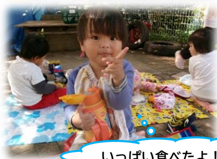
いっぱい食べたよ！