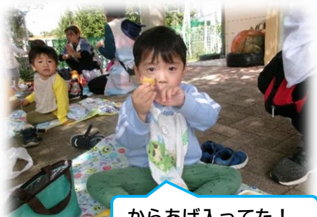
からあげ入ってた！

朝から「お弁当たべたーい！」と楽しみにしていた子どもたち。天気も良くみんなで外で食べることができました。「〇〇入っているよ！」「おいしい！」と話してくれる姿、食べ終わると空のお弁当箱を見せて食べたことを教えてくれた姿はみんな幸せそうでした。