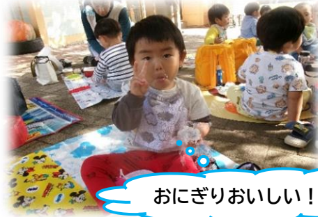
おにぎりおいしい！