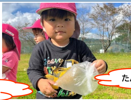
たんぽぽ見つけたよ！