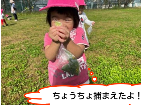
ちょうちょ捕まえたよ！